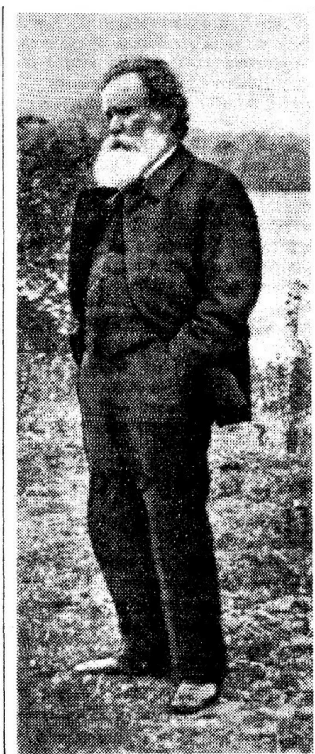
В. Г. Короленко в Хатках под Понтавой. Снимок публикуется впервые.

Борьба за человеческое счастье в разных формах, от самых общих до самых частных, — в этом была его руководящая идея, в этом заключалась для него высшая правда и красота. «Человек создан для счастья, как птица для полета» — такова краткая формула эстетики и этики Короленко. Во имя разума и правды, в глубокой сущности своей совпадающих с красотой, и должен, по мысли Короленко, действовать