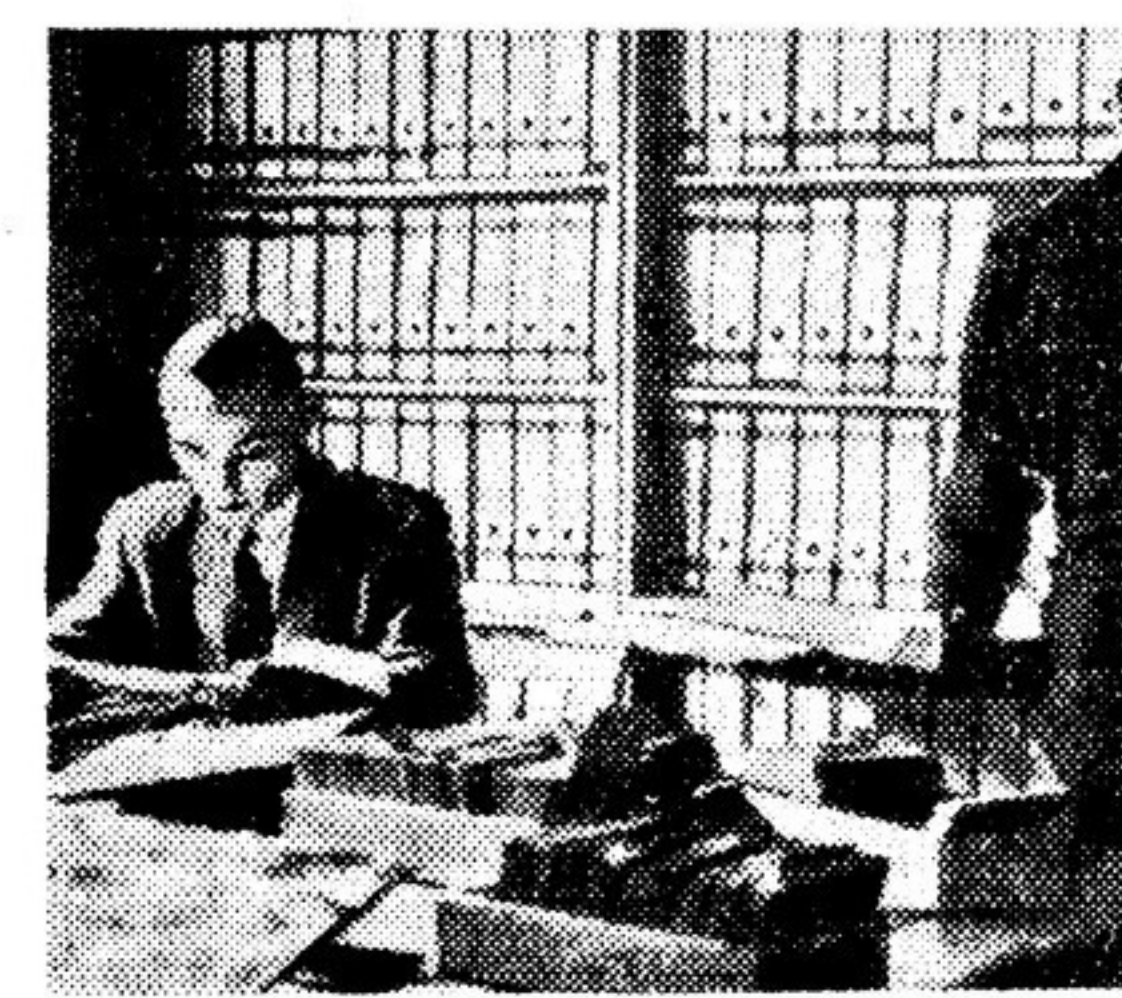
Снимок № 1. В этих папках, хранящихся в казарме Эрменгильдзери в Бонне, где помещается «ведомство Бланка», — списки солдат и офицеров гитлеровского вермахта, которые выразили желание вступить в аденауэровскую армию.

Вот одна из фотографий (снимок № 1). В этих папках хранятся списки бывших офицеров и рядовых гитлеровского вермахта, которые изъявили желание вступить в западногерманскую армию, формируемую Бланком. Другая фотография (снимок № 2) изображает одну из еженедельно пополняемых карточек, содержащих сведения о прохождении военной службы кадровым составом фашистской армии.