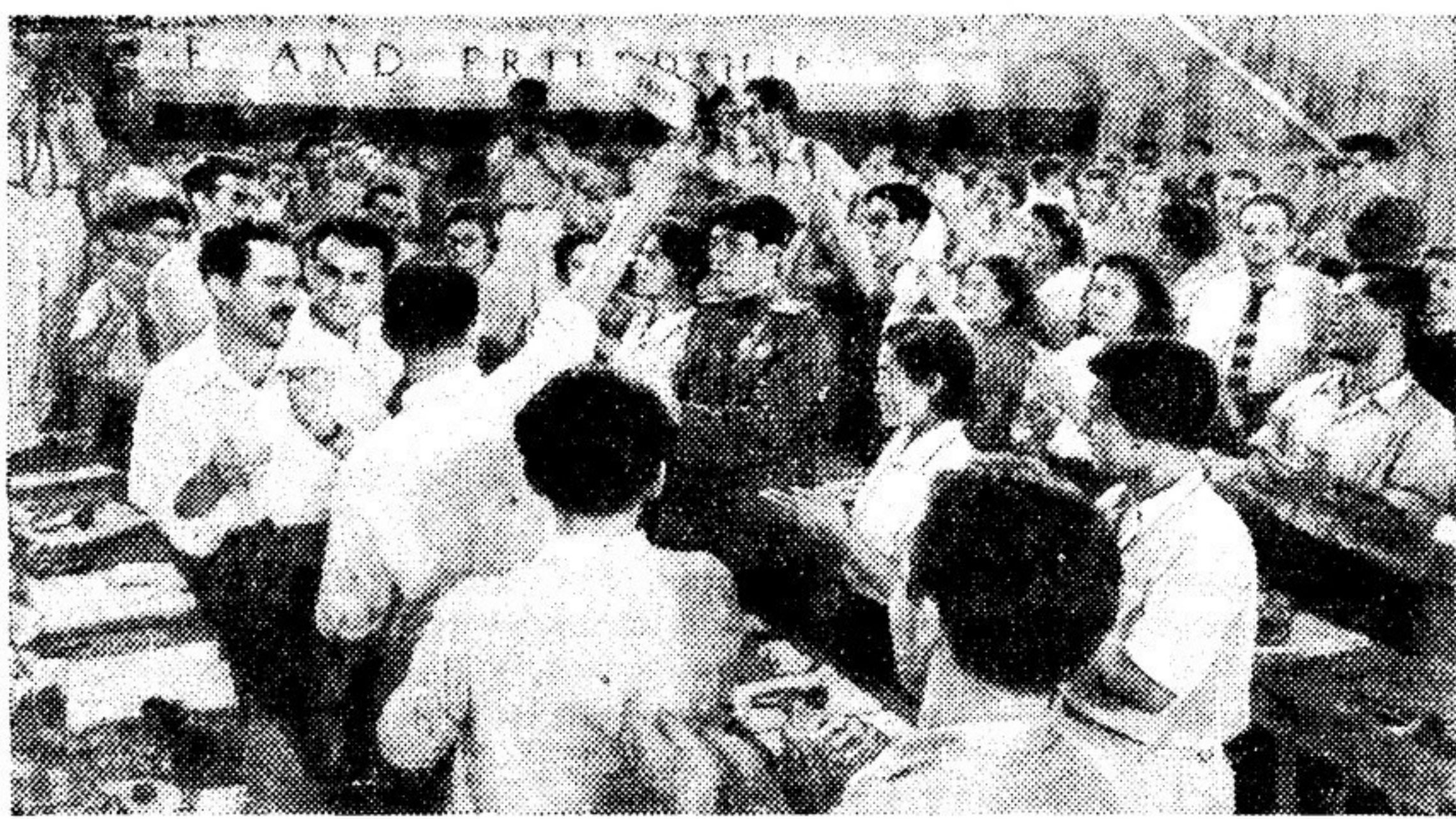
25 июля 1953 года в зале «Флорьяска» в Бухаресте открылся третий Всемирный конгресс молодежи. Делегаты более чем восьмидесяти стран мира горячо приветствуют посланца героической Кореи.